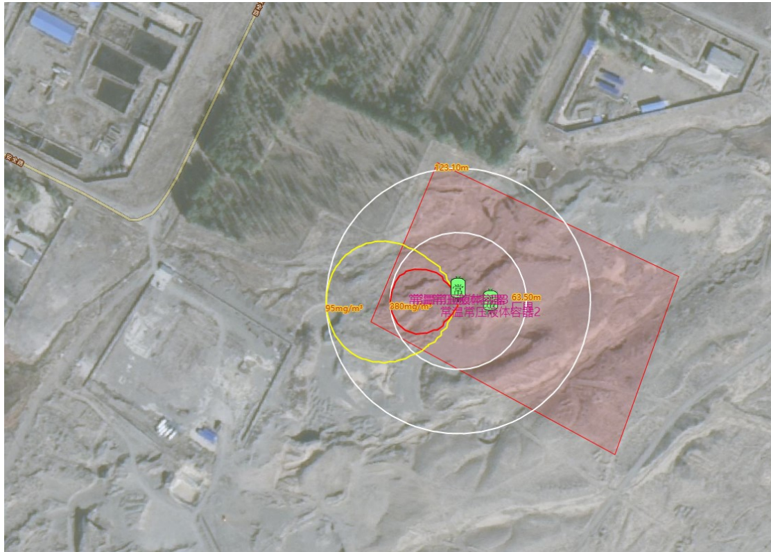
图 CO 预测范围图