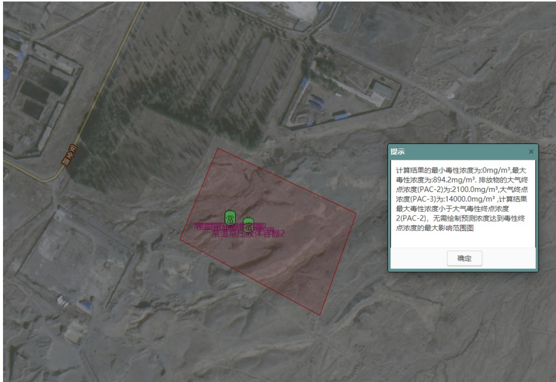
表 6.5-3 甲苯预测结果一览表